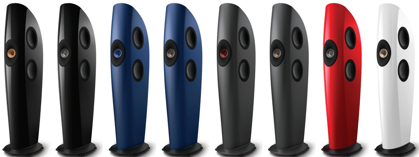
Piano Black/ Copper