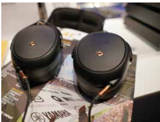
Meze Audio Liric