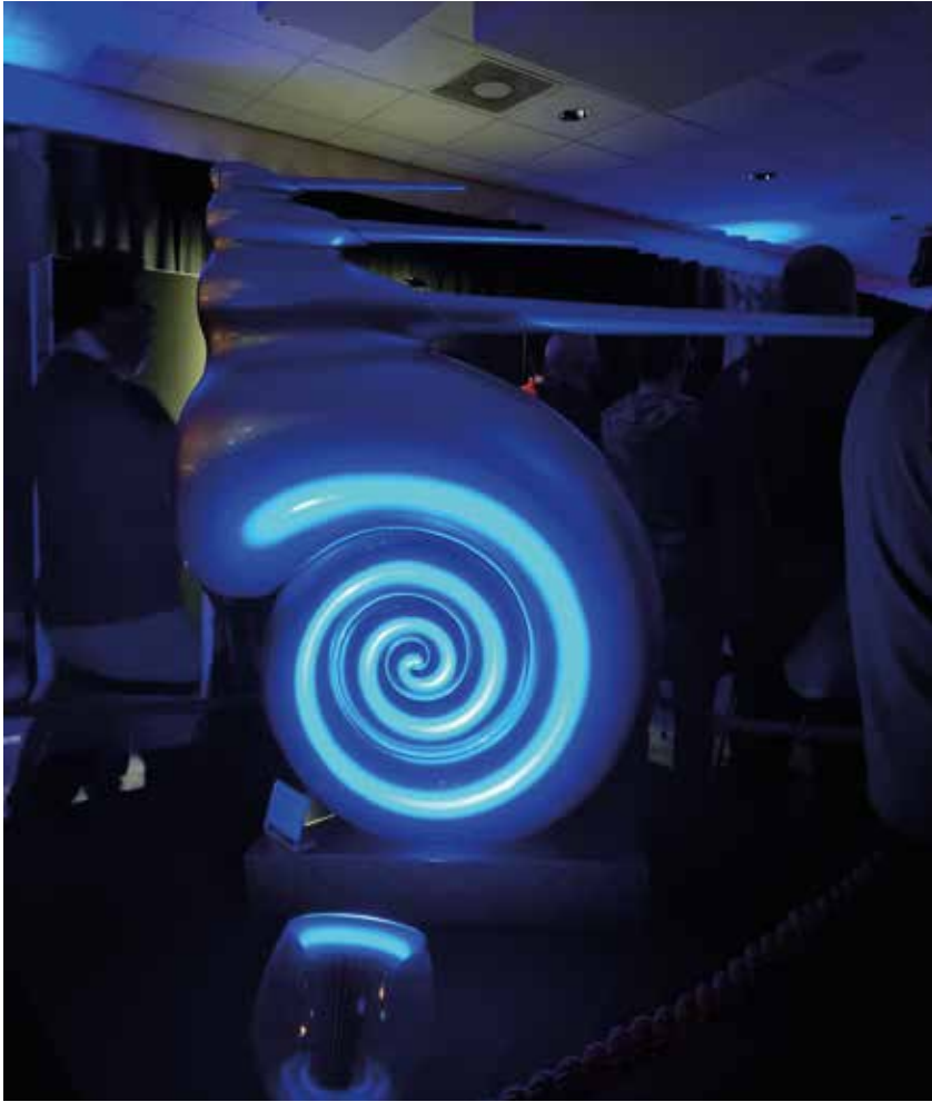
Bowers &amp; Wilkins

mis, die knappe grijze Focal Aria K2-speakers in surround in de kamer van Yamaha of de Naim NDX-streamer en de Supernait 3-versterker die elders op de beurs op wel heel innemende manier de pas voorgestelde Majistra's van Neat Acoustics aanstuurde. Primeur-alert! – er zullen er nog meer volgen. Focal en Naim gingen er in ieder geval met Best Sound vandoor.