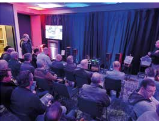
Sonus faber en McIntosh

Bij Latham Audio was ik nog net op tijd om te genieten van de Naim Statement NAC S1 voorversterker en NAP S1 mono eindversterkers, het statement waarmee Naim