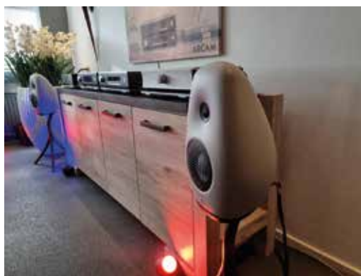
Vivid Audio, MolaMola en Arcam