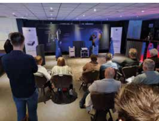
Vivid Audio en Halcro