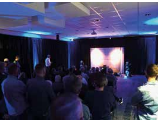
Bowers &amp; Wilkins

Een verslag zou kunnen beginnen bij de voordeur, maar laten we gewoon doen wat vele bezoekers ook deden: hollen naar de ruimte die zustermerken Focal en Naim hadden ingericht. Een spectaculaire start, want de Frans-Britse alliantie pakte groots uit op deze show. Letterlijk, want die Grand Utopia EVO-speakers die ze uit Saint-Etienne hadden meegebracht torenden boven het publiek uit. Je zag wel meer aanwezigen denken bij het horen van de nog nooit in Nederland geziene giganten: "Als we nu onze woning verkochten, zouden we ze dan kunnen betalen?" Nicolas Debar van Focal zorgde van zijn kant voor een prikkelende muziekselectie. Minstens even aantrekkelijk was wat Naim had meegebracht: de fonkelnieuwe en zeer high-end Solstice-draaitafel. Uiteraard mocht ook het vlaggenschip uit Salisbury – de 250.000 euro kostende Statement-versterker – niet ontbreken. Zowel Naim als Focal hadden uiteraard nog meer te tonen op de show, maar we vermoeden stilletjes dat dit systeem toch bij de meeste het langst in het geheugen zal blijven hangen. Nu goed, ook niet