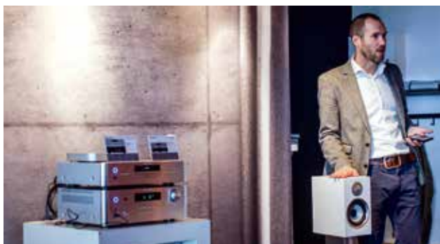
BOWERS & WILKINS

Focus bij Dynaudio op deze show ligt evenwel op de Music-serie, het eerste draadloze multiroomsysteem van de Denen dat door Edwin Vlieger van tekst en uitleg wordt voorzien. Het eerste wat opvalt? De vier familieleden 1, 3, 5 en 7, in diverse uitvoeringen aanwezig, zijn een stukje groter dan we ons hadden voorgesteld. Vooral met de 7 staat er een serieuze alles-in-één speaker voor je, die overigens ook als center in een surround-opstelling inzetbaar is. De gebruiksvriendelijke verschijningen zullen in het gemiddelde