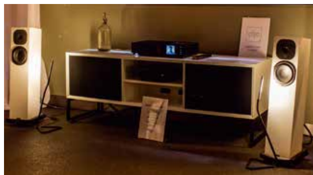
NAIM & NEAT