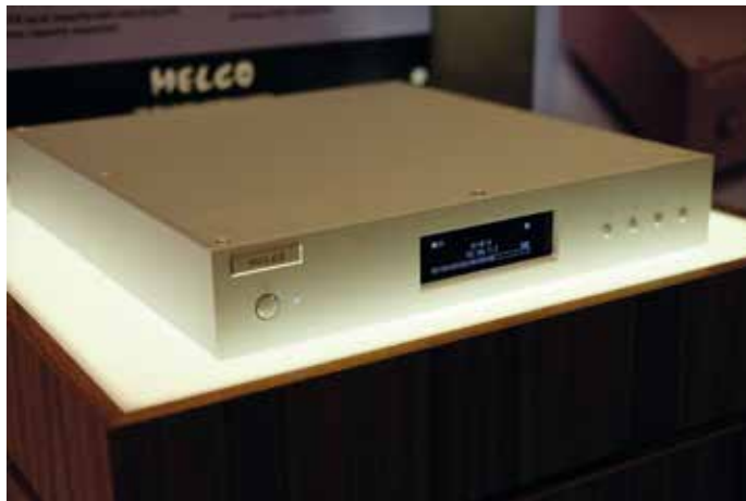
Melco bij Dimex