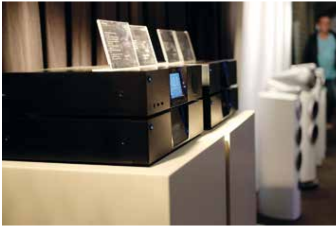
Classé bij de B&W Group