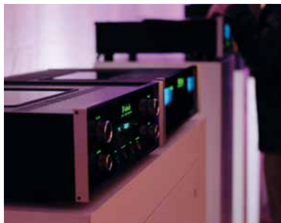
McIntosh bij Audiac