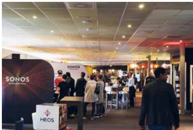
Drukte bij de catering boven